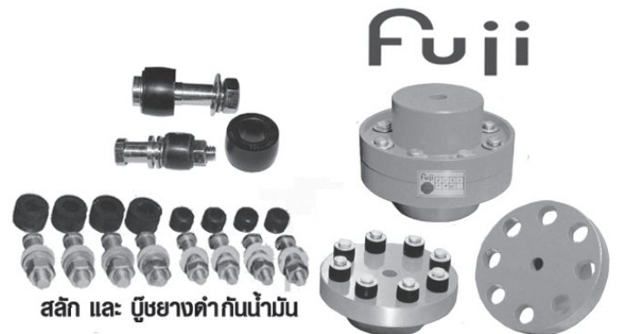
สลัก และ บูชยางดำกันน้ำมัน